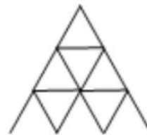
Château à 3 étages

Combien faut-il de cartes pour réaliser un château de sept étages ? de 30 étages ? de 100 étages ?