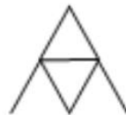
Château à 2 étages